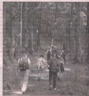
Via Romea di Stade Collegava Roma col Nord Europa