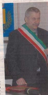
SINDACO Ilario Maggini durante la cerimonia per la firma dell'accordo