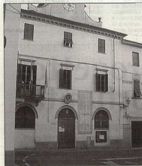
Oggi la firma dell'accordo con il Comune di Santa Sofia nel palazzo municipale di Subbiano