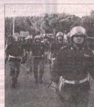
Intervento Polizia allo stadio

SOCI - Presso la Scuola Media XIII Aprile di Soci si è svolto un incontro sul tema della violenza nello sport, con particolare riferimento al mondo del calcio ed al ruolo dell'operatore di polizia nei servizi di Ordine Pubblico. Nel corso dell'intervento, il dr Paolo Terracciano, Vice Questore Aggiunto della Polizia di Stato, Dirigente l'Ufficio Prevenzione Generale, ha illustrato l'attività di prevenzione svolta dalla Polizia in relazione alle manifestazioni sportive, nonché le fasi preparatorie degli eventi sportivi dal punto di vista dell'Ordine Pubblico. L'incontro sollecitato dai ragazzi attraverso il loro insegnante Don Francesco Capolupo, anche a seguito di spiacevoli episodi di violenza che anche recentemente sono accaduti negli stadi, rappresenta una buona occasione per rendere più visibili una serie di attività poste in essere dalla Polizia e che danno conto di una strategia complessiva che inserisce i poliziotti nell'alveo di operatori della sicurezza evitando che